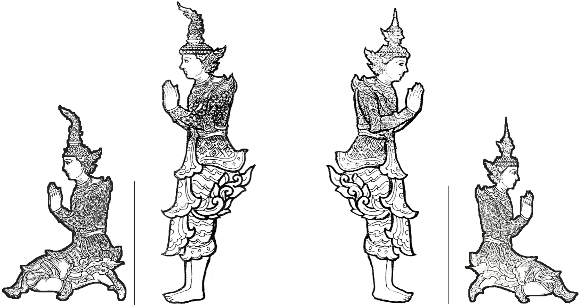
ဝိဇ္ဇပ္ပကုဗ္ဗနတ်မင်း (အနောက်အရပ်)